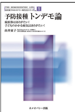
『予防接種トデモ論』 由井寅子 著 ホメオパシー出版 刊

抗ウイルス薬というのは、人の細胞内でウイルスの遺伝子の複製を妨害する薬ですが、それだけを妨害するのではなく、人の遺伝子の複製をも妨害する可能性があり、そういう意味で毒性が強いものです。また、高熱や頭痛には解熱鎮痛薬が用いられますが、それらを用いて症状を抑圧することで、特に、1歳代を中心に5歳未満の幼児で脳炎や脳症（いわゆる「インフルエンザ脳症」）を多く発症し、激しいおう吐を起し、意識不明に陥ることがあります。インフルエンザ脳症にはいくつかのタイプがあるとみられています。その1つと考えられるライ症候群※の場合には、イン