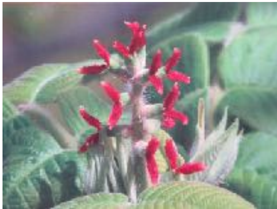
体温上昇 手足の温かさ