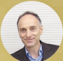
ジェフリー・スミス 遺伝子組み換え問題の専門家